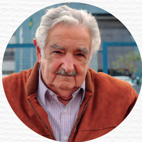
José “Pepe” Mujica C.

Escuchamos atentos la magistral reflexión de nuestro Invitado Especial, el querido Expresidente de la República Oriental del Uruguay, José “Pepe” Mujica Cordano y finalmente, disfrutamos el esperanzador diálogo con otro Invitado Especial, el querido Premio Nobel de la Paz, Adolfo Pérez Esquivel.